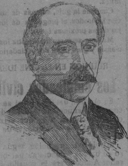
D. PIO BAROJA,

ilustre escritor que acaba de publicar «Los caudillos de 1870», siendo muy encomiados por la crítica.