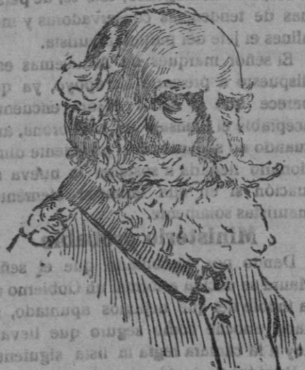
GENERAL FALKEN-HAUXEN, gobernador alemán de Bélgica.