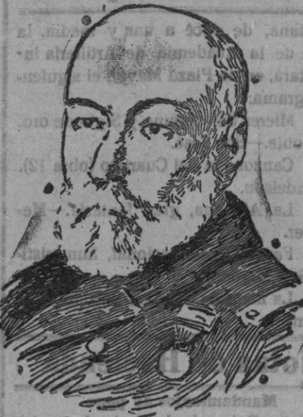
El almirante don José Pidal Ascendido a capitán general de la Armada.