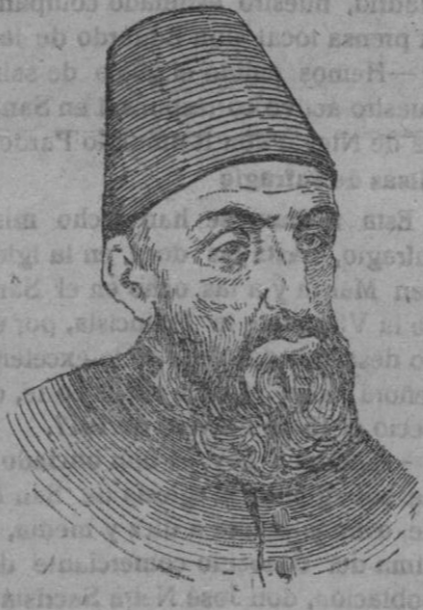
El ex sultán turco Abdul-Hamid, que ha fallecido en Berna, de una pulmonía.