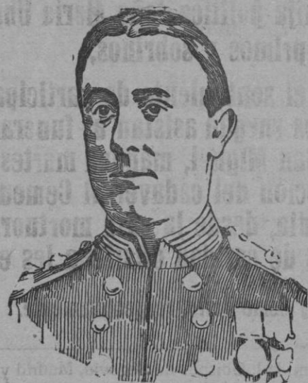
ALMIRANTE PELLICOE, que ha sido destituido del mando de la flota de guerra inglesa.