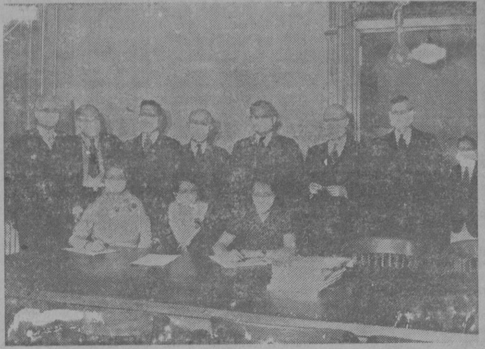
UNA TEMPESTAD DE ARENA HA HECHO JENMUDECER AL SENADO DE TEXAS. Una violenta tempestad de arena ha devastado recientemente varios estados de la América del Norte. Varias ciudades han sido invadidas y varias extensiones de terreno han sido cubiertas de una arena muy fina, habiendo sido destruidas todas las cosechas. Los miembros del despacho del Senado de Texas a Austin, sorprendido por la tempestad de arena durante una sesión, han tenido que taparse la boca con pañuelos

El embajador de Francia en dicha capital François Poncet, estaba esperando en la estación del Jardín zoo.