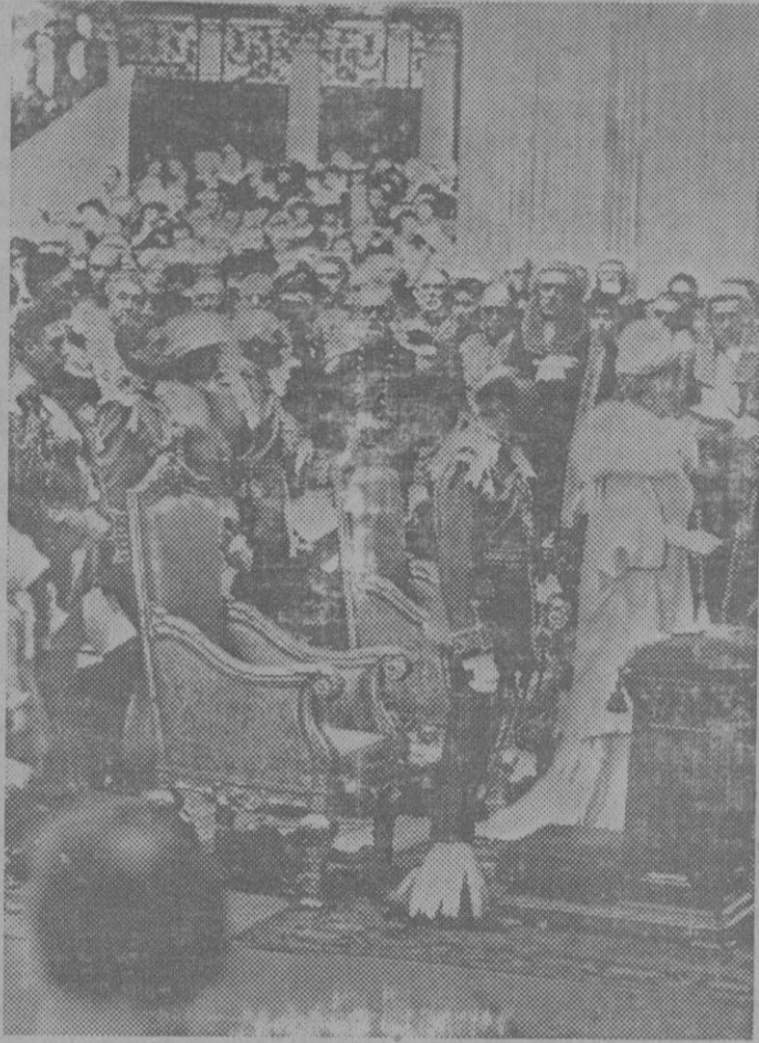
EL JUBILEO REAL INGLÉS.—Con un esplendor extraordinario se celebraron en Londres las ceremonias del Jubileo real de plata. En la Iglesia de San Pablo, tuvo lugar la ceremonia religiosa. Los soberanos delante de los príncipes de sangre y los otros miembros de la familia real. De frente se ve con su uniforme oscuro M. Romsay Mac Donald. (Fotografía llevada en avión).

En cuanto a nosotros como desde el advenimiento de la República estamos gobernados por la incoherencia, no se puede presumir como liquidaremos nuestros pleitos con el país vecino. Al régimen no le preocupan sino las minucias doctrinales. Lo que importa no es la vida del español sino el establecer claramente si nuestra miseria habrá de ser administrada por las iz-