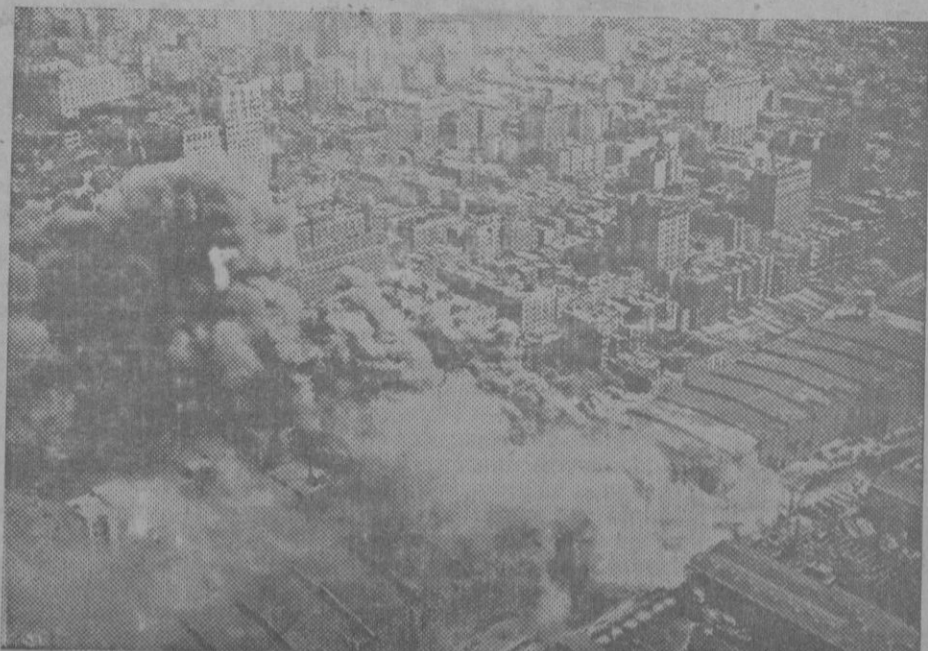
GRAVE INCENDIO EN NUEVA-YORK.—Un grave incendio ha tenido lugar recientemente en el puerto de Nueva-York, un gran depósito de mercancías de los Docks ha sido convertido en pasto de llamas. Los bomberos tropezaron con muchas dificultades para poder dominar el fuego pues una intensa humareda impedía todo movimiento y a causa del fuego un coche de los bomberos hizo explosión. El siniestro visto desde un avión.