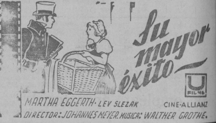
MARTHA EGGERTH-LEV SLEZAK DIRECTOR: JOHANNES MEYER. MUSICA: WALTHER GROTHE.