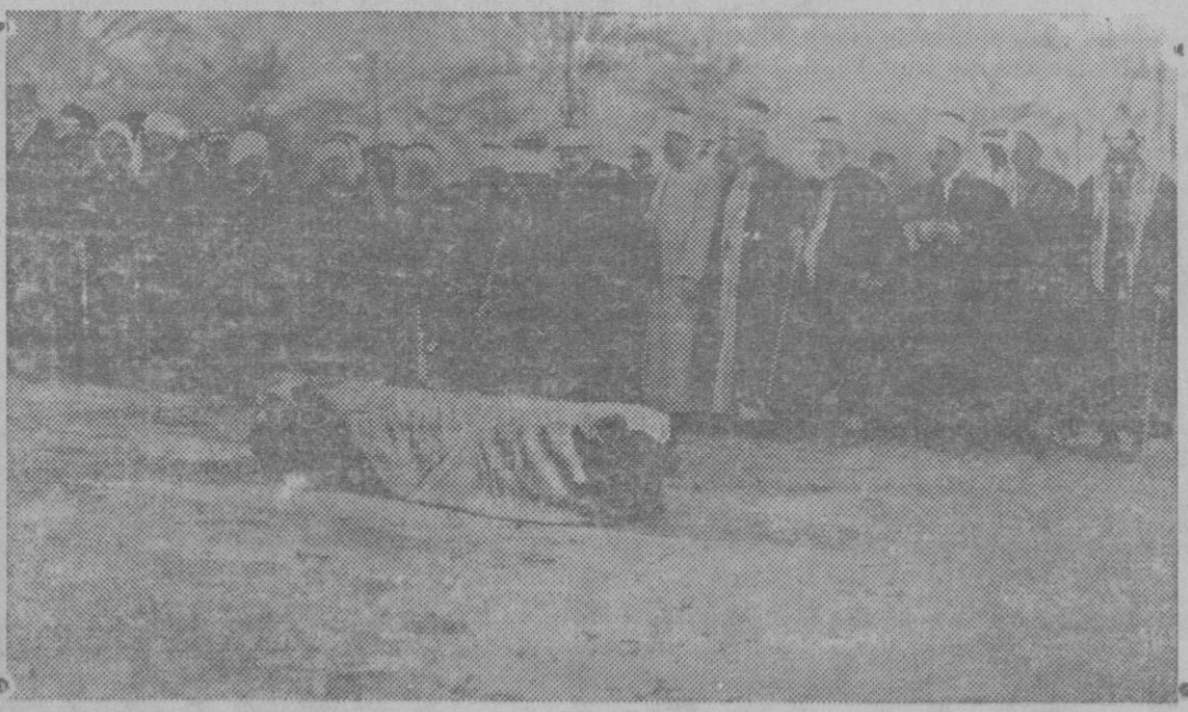
ENTIERRO DE LA REINA MADRE DE IRAP.—En Bagdad han tenido lugar recientemente las honras fúnebres de la reina madre de Irap, recibiendo los restos sepultura cerca de la tumba del difunto Rey Feisal. La reina madre que tenía 50 años de edad, falleció a consecuencia de un ataque cardíaco. Este entierro fué el primer entierro oficial para una mujer musulmana en Irap. Los sacerdotes rezando delante del ataúd, durante la ceremonia de los fúnebres en Bagdad.

Tres escritores derechistas uno de ellos soldado—tres creyentes en aquello que nuestra juventud fingía despreciar, han sido elegidos académicos en Francia. En casi toda Eu