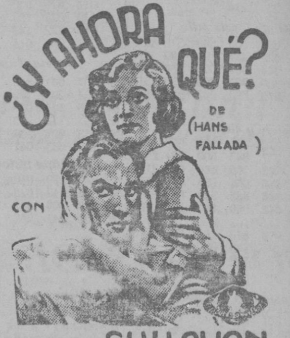
MARGARET SULLAVAN PELÍCULA UNIVERSAL

Todos los días a las 3'30 Un film INCOMPARABLE! La novela que se ha traducido a 18 idiomas del poeta Hans Fallada