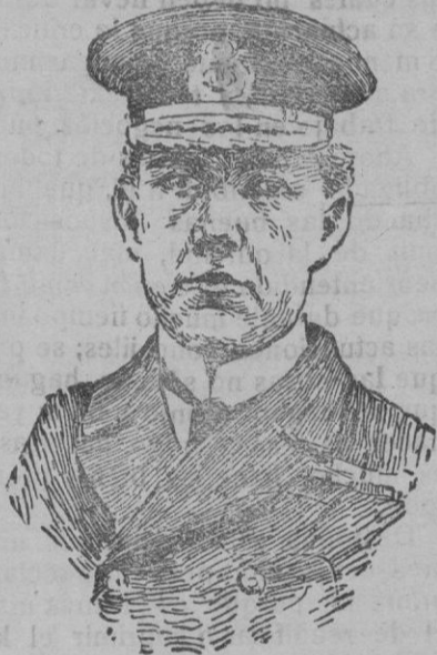
El almirante inglés sir Warrender recientemente fallecido en Londres