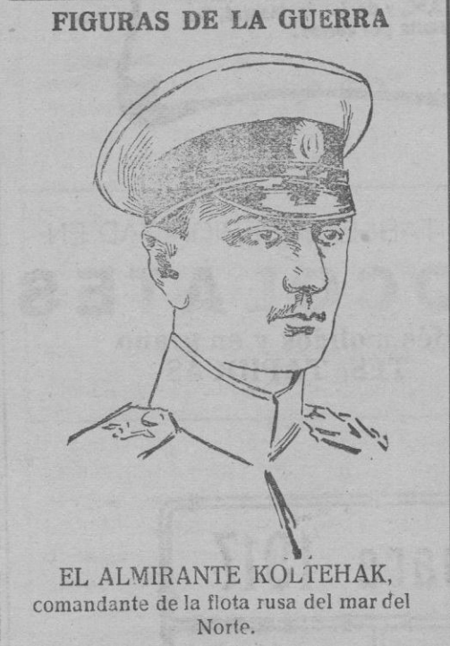
EL ALMIRANTE KOLTEHAK, comandante de la flota rusa del mar del Norte.

anotadas en registro aparte. Se determinará, en caso necesario, un prorrateo mensual y quincenal en casos especiales entre los diversos centros productivos concurrentes en una misma estación. Si los remitentes no cargan los vagones dentro del plazo preciso, se entenderá caducada la petición. En los que se atribuyan la condición de remitente en interés ajeno o cualquier otra declaración falsa para lograr preferencias en perjuicio de tercero, intervendrán los Tribunales de Justicia.