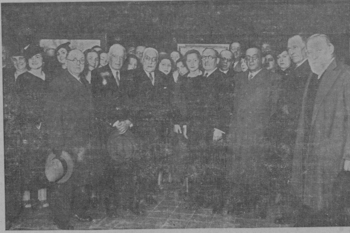
«GALERIAS COSTA».—Inauguración de la Exposición Guasp Pou