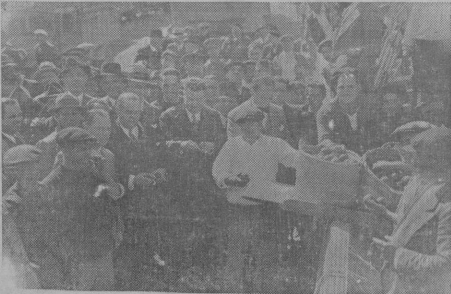
LA EXPORTACION DE LA NARANJA, VALENCIA.—El Ministro de Agricultura y el Sub-secretario de Industria y Comercio comprobando la buena calidad de la naranja valenciana, que se embarca en el puerto de Gandia para el extranjero.

Lo que hace que los amantes no se cansen de estar juntos es hablar siempre de si mismos.