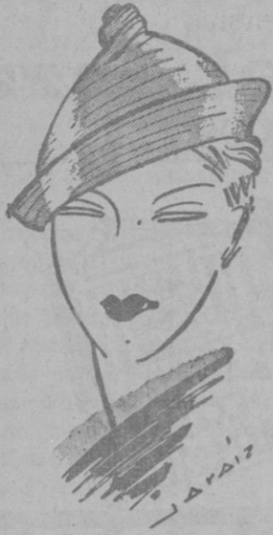
Sombrero de fieltro gris, flexible. En la parte superior, termina anudado en forma de campana y por la parte baja, el ala es amplia y vuelta.