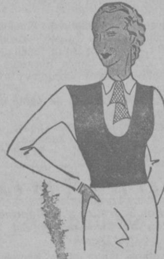
Trajecito de lanilla blanca acompañado de un jersey azul marino. La corbata es de las llamadas escocesas.