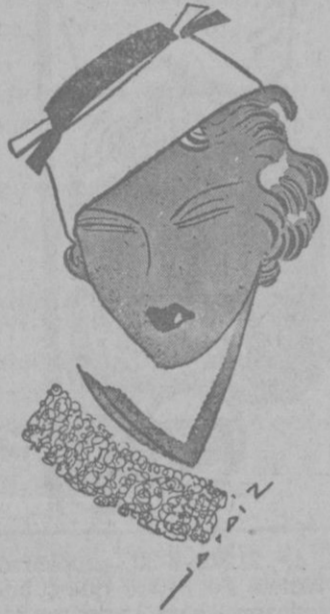
Moderno sombrero de «velours» negro y verde. Su caprichosa forma está inspirada en los primeros modelos para primavera.