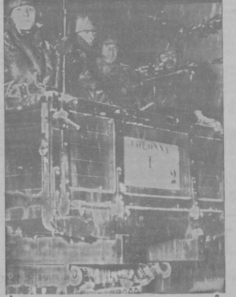
Han tenido plena confirmación los pronósticos que daban por seguro, como resultado del plebiscito del domingo, el retorno del Sarre a Alemania.