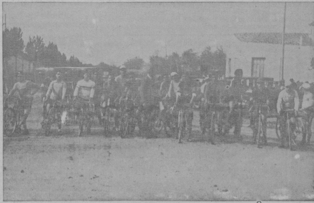
Los corredores que tomaron parte en el I gran trofeo Copa Navidad resultando vencedor Llompart