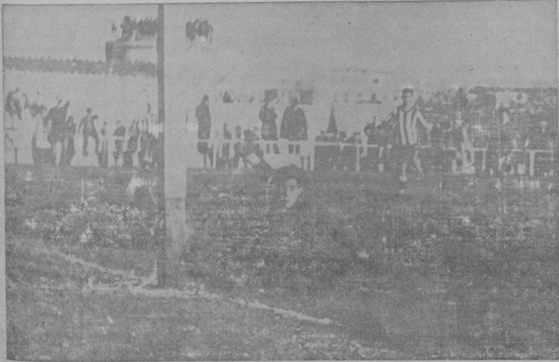
El tercer goal marcado por Aubella del Mallorca