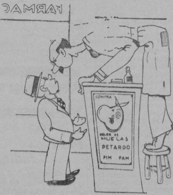
—No puedo pegar los ojos en toda la noche, tiene usted algo bueno? —Sí señor, goma arábiga.