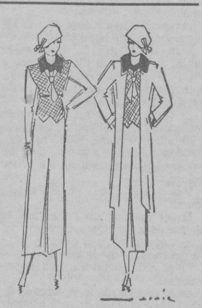
Apunte para la actual temporada.

Inclinaremos el cuerpo hacia los lados y por último efectuaremos un movimiento rotatorio de derecha a izquierda y viceversa.