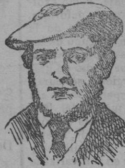
El general Zurbano

Los hechos que en la guerra civil realizó Zurbano fueron tan grandes y señalados, que á la terminación de ella