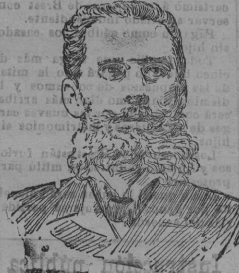
Don Cayetano Sánchez Bustillo NUEVO MINISTRO DE HACIENDA