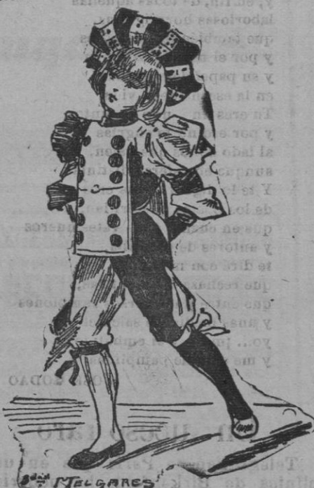
DOMINÓ.—Para niño de cinco á diez años: Traje de raso blanco y negro. Los redondeles que figuran la ficha del dominó son de raso negro en una tira de raso blanco.

He aquí los pormenores de estos dos modelos: