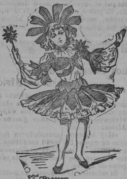
MARGARITA.—Para niña de tres á doce años: Bolero de raso verde-foja con tiras

de raso blanco recortadas en forma de pétalos. Co-ro teada una capotita de terciopelo amarillo aureolada de grandes pétalos de raso blanco.