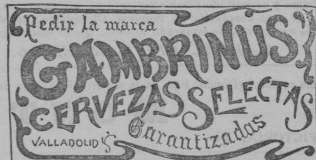
Medalla de oro.—París y Londres. 1902.

Clases de Matemáticas, Topográfico y Física, prácticas de