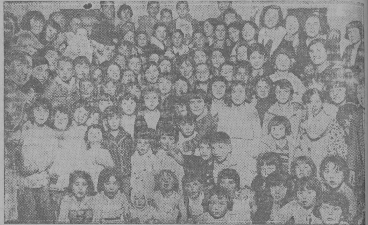
Grupo de niños concurrentes al baile infantil verificado en el Ateneo Cultural Hercullino, para celebrar la festividad de los Magos

La cuestión de la enseñanza y la administración de justicia