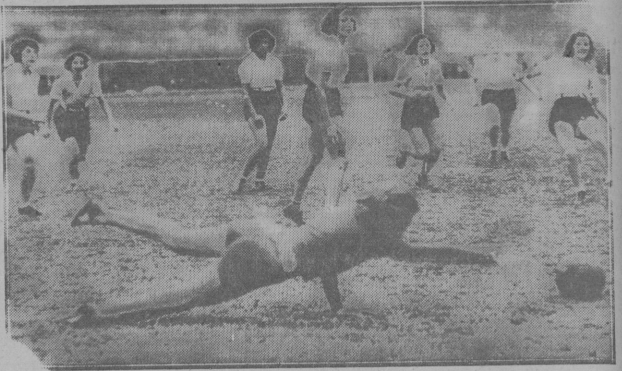
Un momento del primer partido de fútbol jugado por muchachas en California entre los equipos Magyart y Athletic Club de Pasadena