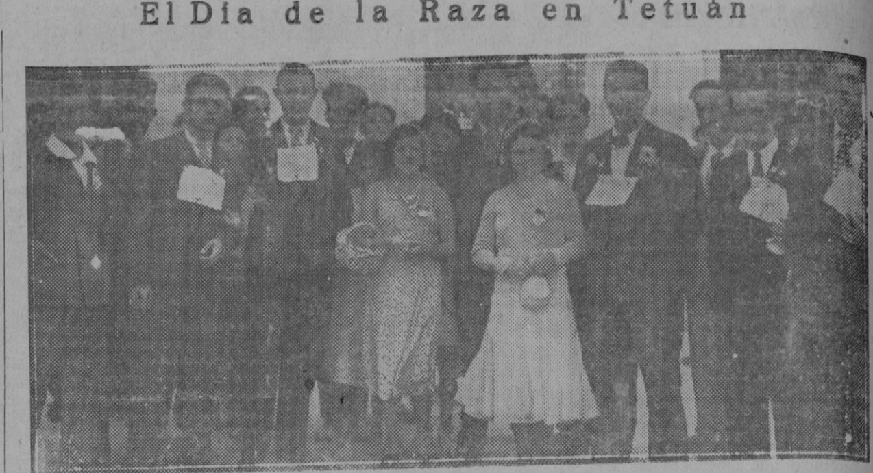
Curiosa fotografía de dos bellas postulantes de la Fiesta de la Flor y algunos muchachos que ostentaban cartelitos prendidos en la solapa, que decían: «No me pongáis más flores!», cartelitos que hacían reír a las bellas postulantes, pero cuyo texto no respetaban

21.00: Campanadas horarias de la Catedral. Parte del servicio meteorológico de Cataluña. Estado del tiempo en Europa y España. Previsión del tiempo en el NE. de España, en el mar y en las rutas aéreas. Cotizaciones de mercancías, valores y monedas.