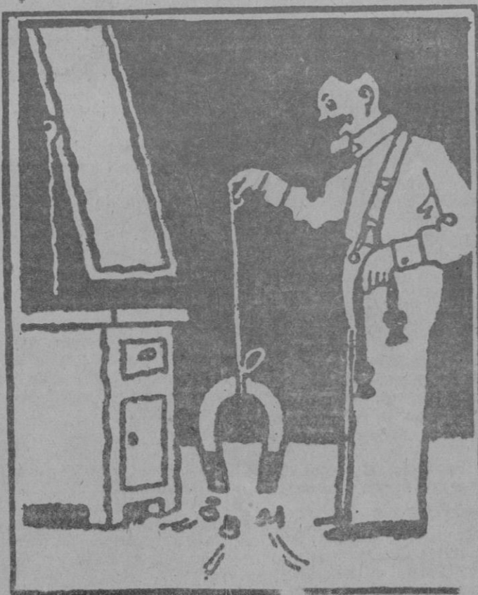
Método ingenioso para encontrar enseguida los botones de camisa que se pierden.