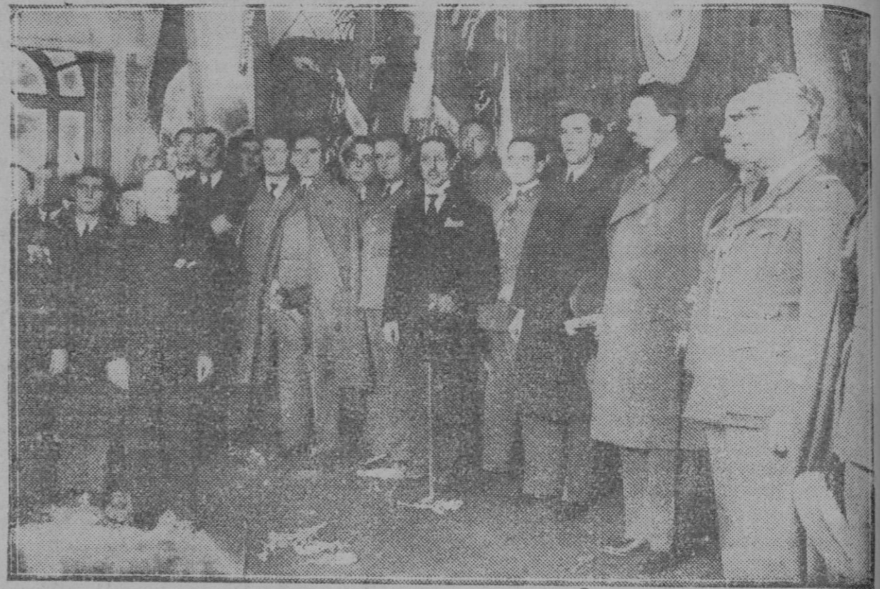
Después del desembarco del general Balbo y demás compañeros de travesía, los aviadores visitaron la Casa de Italia donde se celebró una solemne recepción