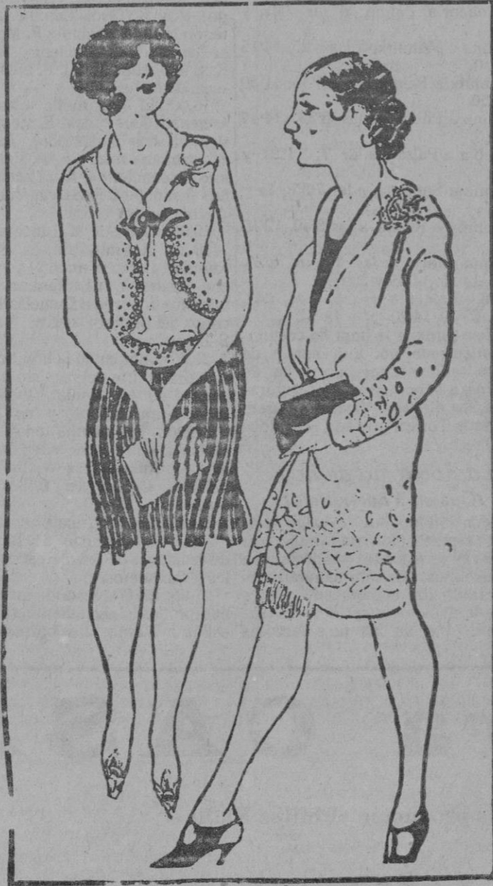
—¿Has vuelto del viaje de novios? ¿Qué tal? —¡Ah! Mi marido ha estado tan obsequioso conmigo que nadie nos tomaba por casados.

En cuatro departamentos e institutos autónomos—el de Patología, el de Física, el de Fisiología y el de Química—se halla dividido este nuevo centro de estudio, última creación de la benemérita Sociedad Kaiser Wilhelm, bajo cuyo patronato viven y trabajan hoy en Alemania más de 30 instituciones consagradas a la investigación de las más diversas ramas de la ciencia y al estudio de sus aplicaciones.