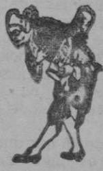
A los pies de Vd.