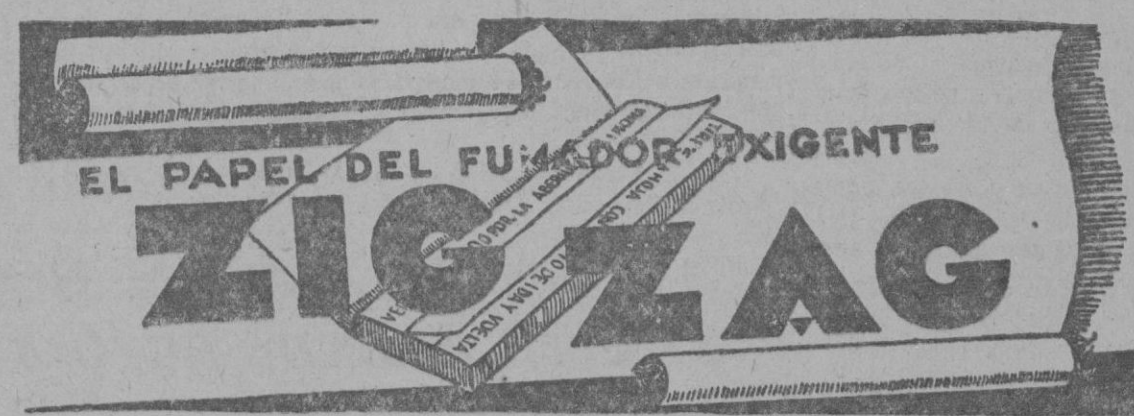
«En la Exposición de Barcelona, 1929 fuera de Concurso, Miembro del Jurado»

En breve: Inauguración del Tiro de Salón, Cuartos de baño de mar y dulce caliente.