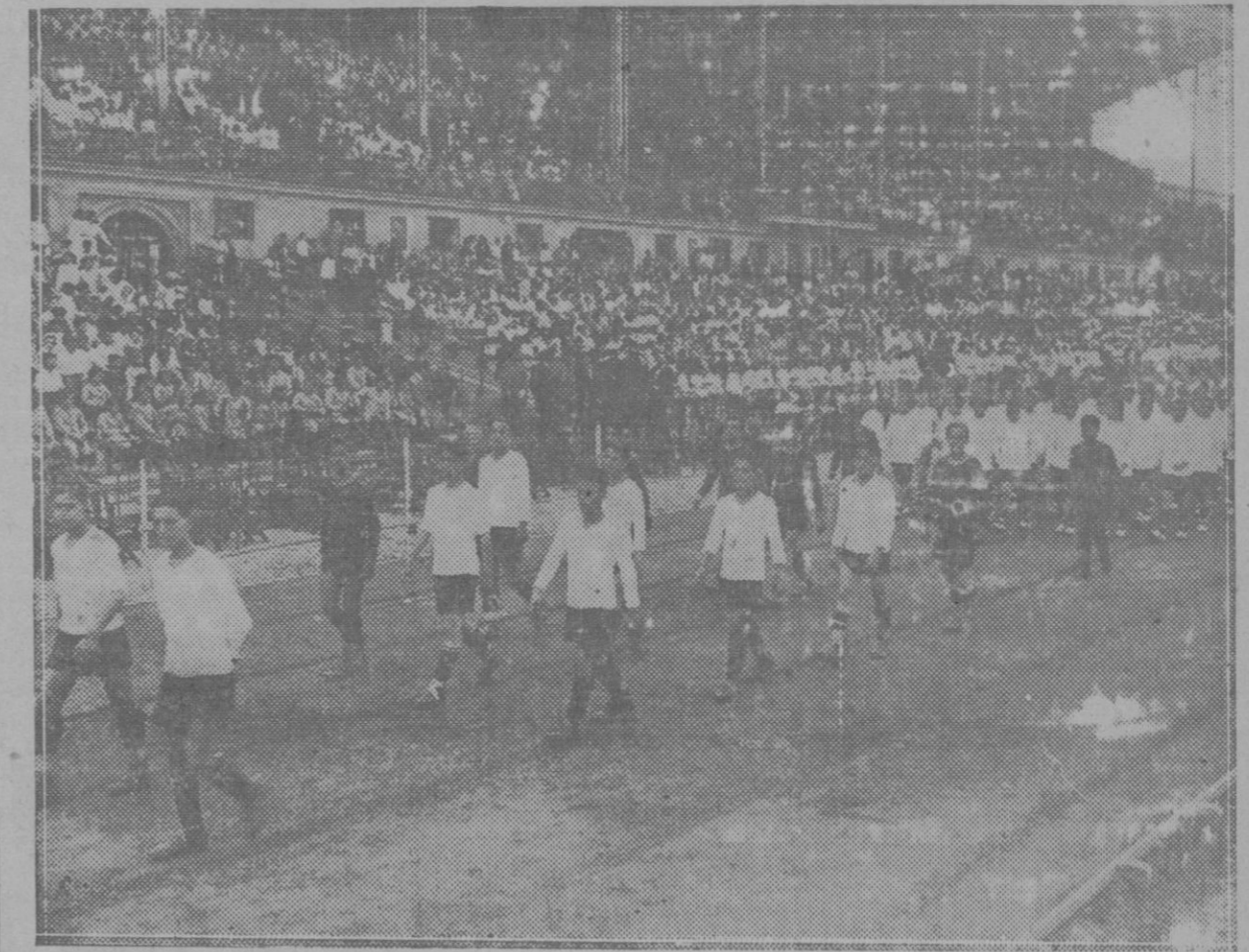
Barcelona: Aspecto del festival infantil celebrado en el estadio de la Exposición con motivo de la Semana Hotelera

nes invitaron a merendar con pasteles que tenían el doble mérito de ser hechos por el Compositor de moda en los Estados Unidos.