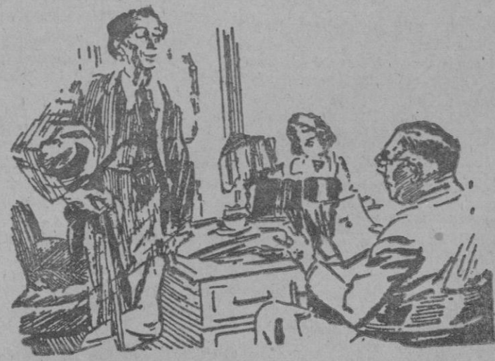
El escritor.—Aquí le traigo el manuscrito que le ofrecí el año pasado. El editor.—¿Y por qué me trae esto, que ya le he rechazado una vez?