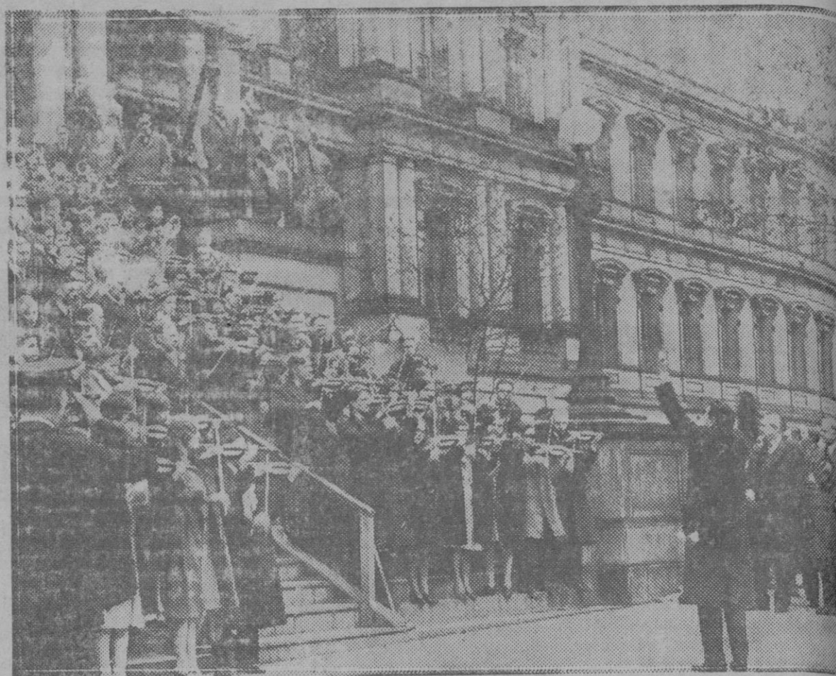
Las escuelas nacionales de segunda enseñanza tienen una orquesta, en la que figuran hijos de personas norteamericanas. Entre los alumnos se cuentan jóvenes naturales de cuarenta y tres Estados. El concierto lo están dando ante el Presidente Hoover, en las gradas de las Oficinas Temporales