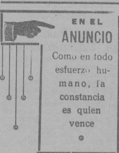
EL DIA publica diariamente 8 páginas

Modificando el reglamento para la aplicación del reglamento del Código Penal para la libertad condicional.