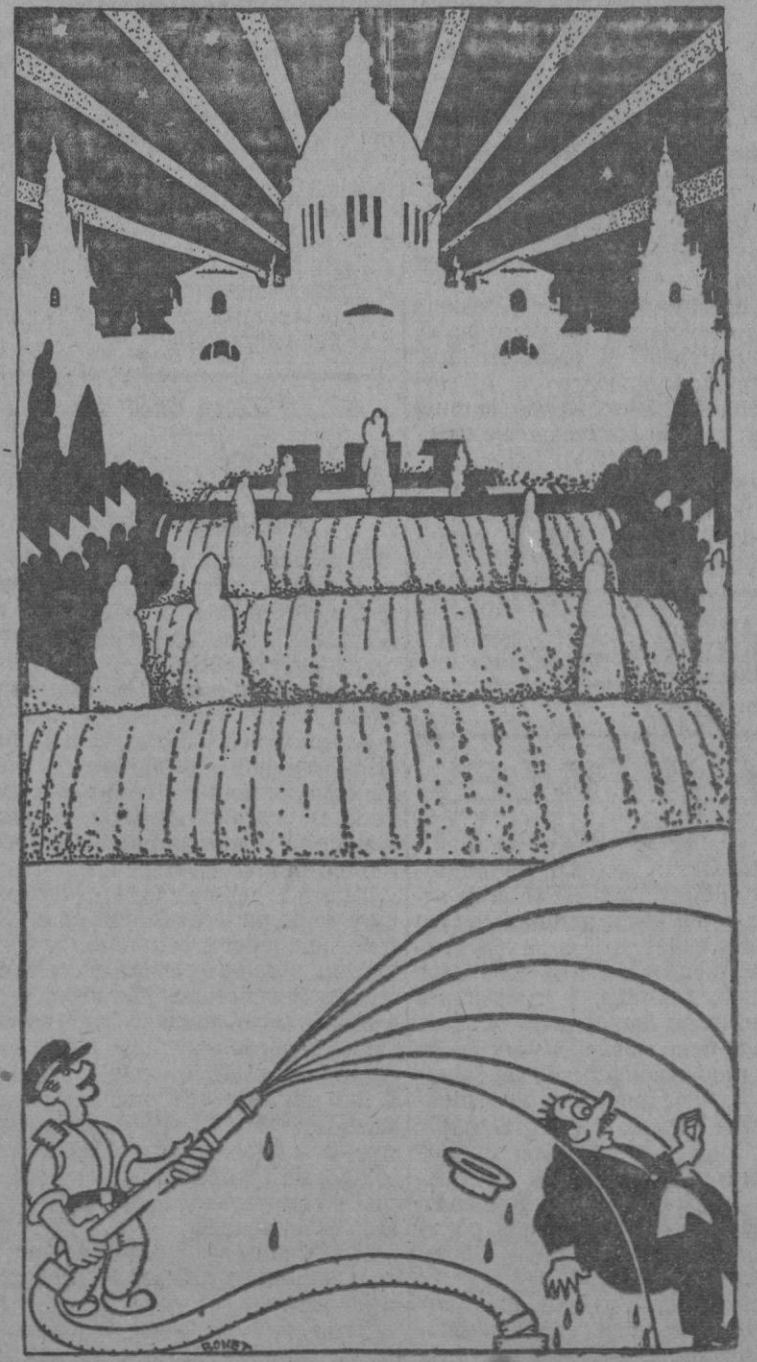
Los juegos de aguas de la Exposición.—Sorprendente efecto de un salto de agua visto de noche. Y otro salto de agua visto de día