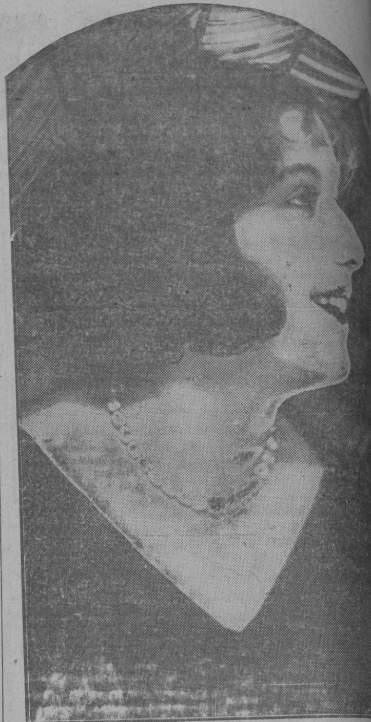
Una hermosa representación de las mujeres de Nijni-Novgorod