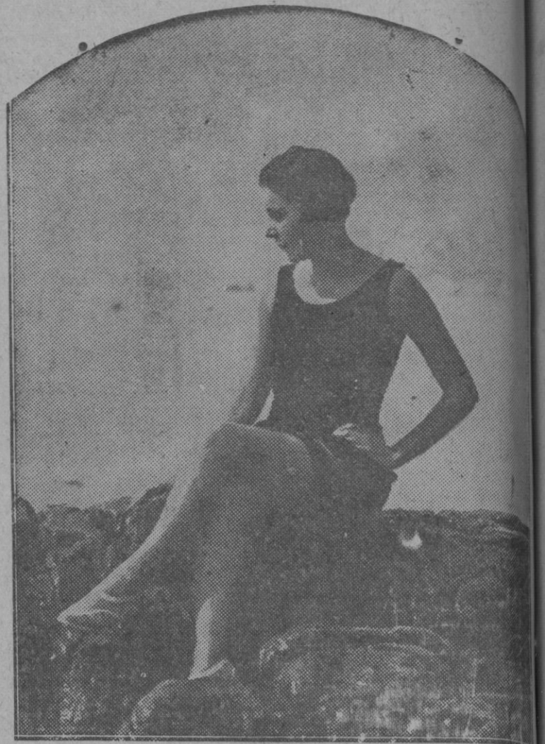
La notable tiple Italiana Wando Bardone en las playas de Alasio (Italiana)