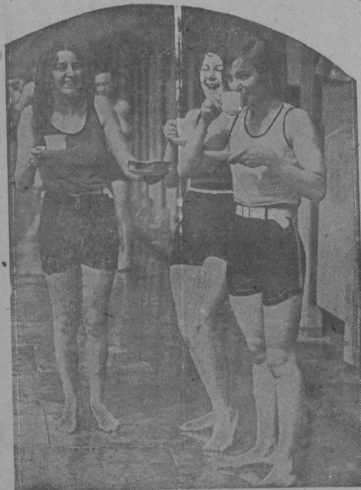
Varias nadadoras del Club Weylle, de Londres, tomando el té después de uno de sus diarios entrenamientos

Palacio del Calzado Quint 9, 11 y 13 PALMA