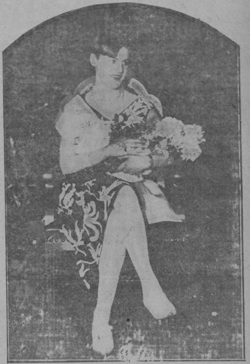
La señorita de Breslau premiada en el concurso regional de Berlin