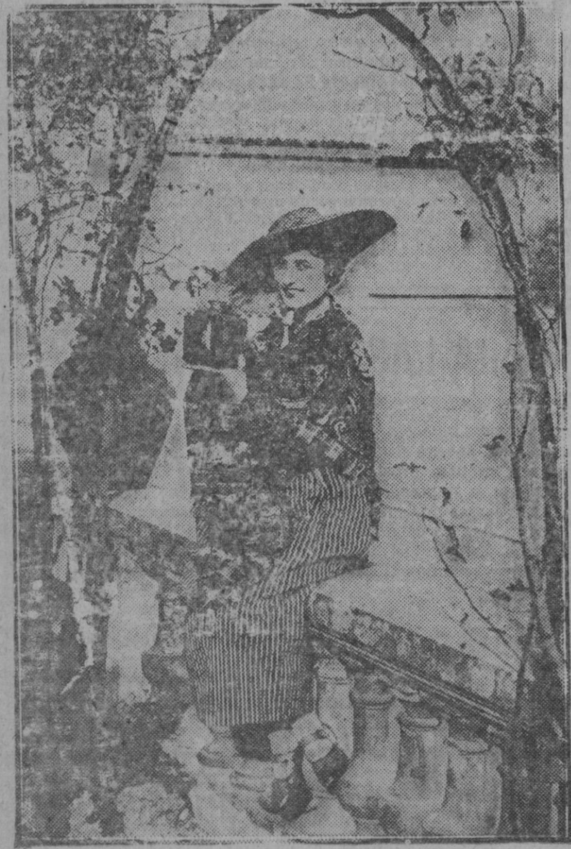
Una linda obrerita de una de las fábricas de perfumes del pueblo de Grasse, cerca de Cannes, en la Riviera, vestida con el traje regional. Grasse tiene una gran riqueza: las rosas silvestres que en enorme cantidad alfombran sus campos, y de las que se extrae la esencia «Altar de Rosas», de fama en todo el mundo