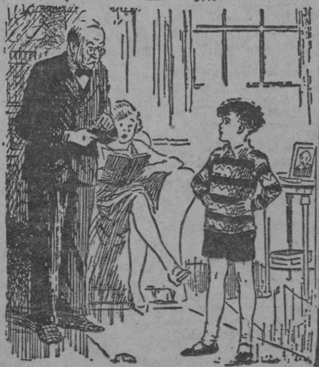
El niño artista de cine, al padre.—Dime, papá: ¿cómo hacías para ganarte la vida antes de conocerme?