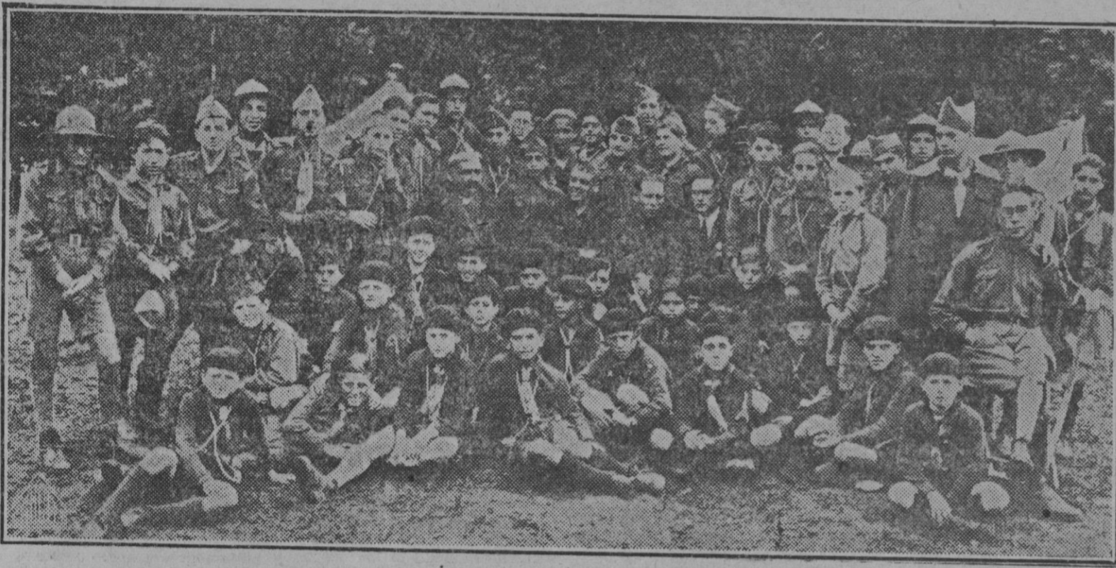
La Coruña: Grupo de Exploradores que han estado acampados en las inmediaciones de la capital haciendo vida y prácticas de campamento