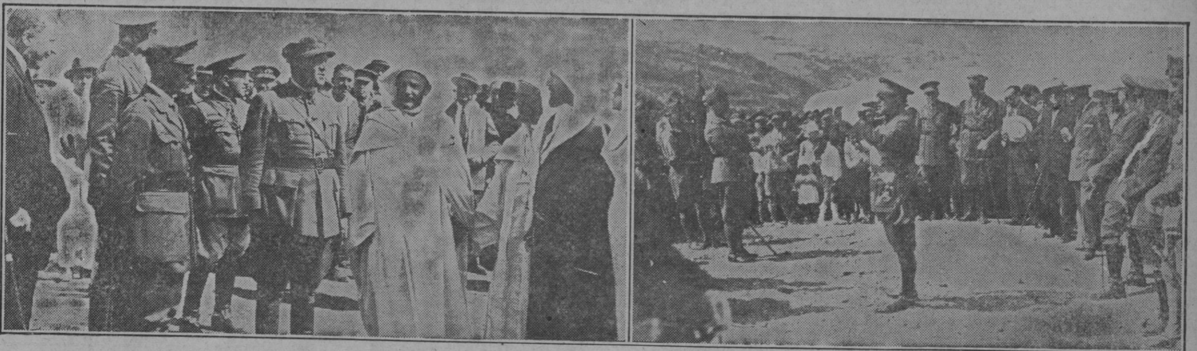
Notas de Marruecos: 1. El general García Benítez, durante la visita a la zona de Larache, es saludado por el bajá de Arcila y otros moros notables.—2. El general en jefe de la Circunspección del Rif, D. Angel Dolla, pronuncia un discurso en el tercer aniversario del desembarco de Alhucemas