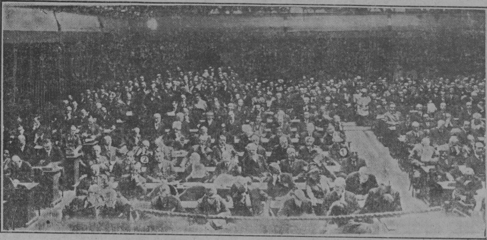
Aspecto del salón durante una de las sesiones. Entre los concurrentes figuran Briand (1) y Quiñones de León (2)