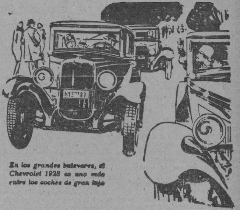
En los grandes bulevares, el Chevrolet 1928 es uno más entre los coches de gran lujo

Además de la armónica combinación de sus finos colores y el lujo de detalles de su interior, el Chevrolet tiene una amplitud en la que cinco personas encon-