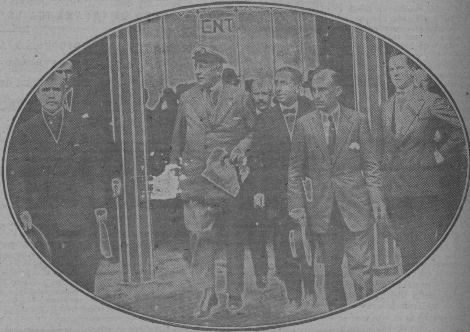
El general Primo de Rivera saliendo de visitar el Certamen d. l. T. a. b. j. o.