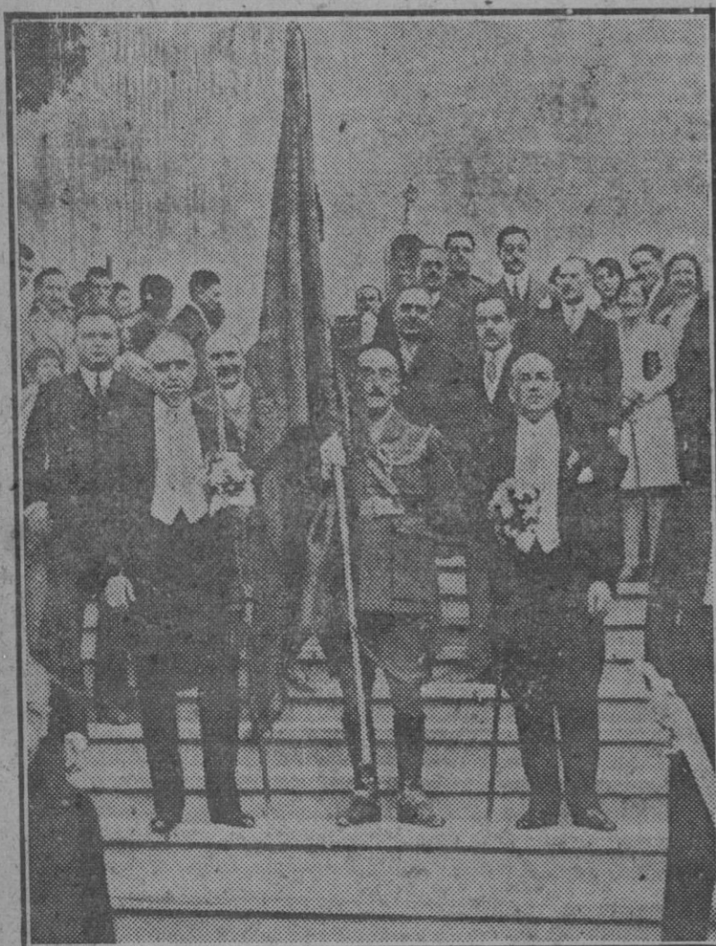
Canet de Mar (Barcelona): El gobernador civil, el presidente de la Diputación y el alcalde de Barcelona en la solemne procesión celebrada en dicho pueblo