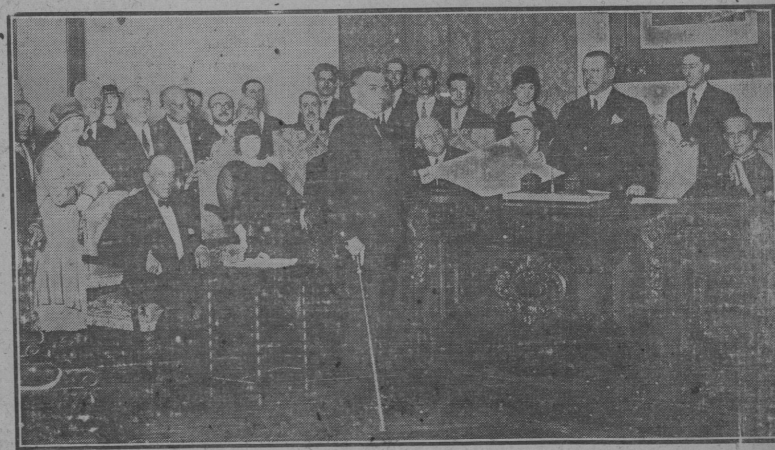
El ministro de la Gobernación entregando los diplomas a los seis delegados que fueron premiados por su meritisima labor en el desempeño de sus cargos