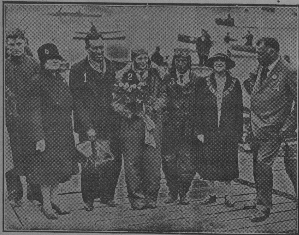
El mecánico Luis Edward (1), la señorita Amelia Barhart (2) y el piloto Wilmer Stultz (3), tripulantes del «Friendship», a su llegada a Southampton, acompañados del alcalde de dicha población, mister Foster-Walch (4)

El pabellón de la Prensa hispanoamericana de Colonia