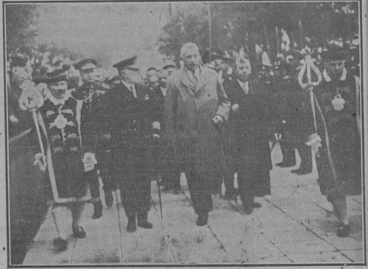
El presidente del Consejo, con el capitán general del departamento, alcalde y otras autoridades, al dirigirse a descubrir el monumento a los soldados muertos en campaña