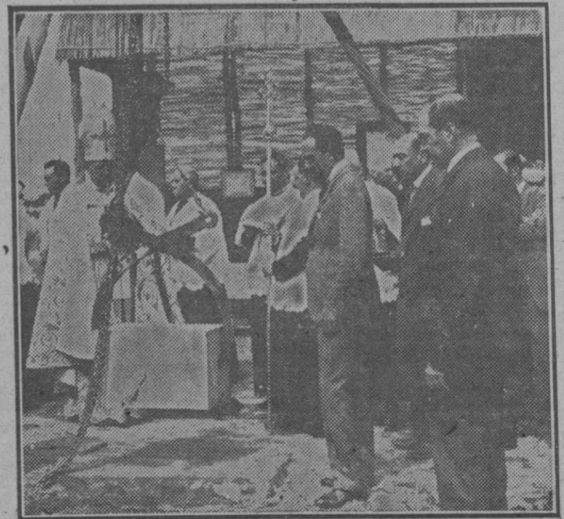
Su majestad el Rey presidiendo el acto de ser bendecido por el cardenal-arzobispo Sr. Irujo en el lugar donde se edificará la iglesia de Nuestra Señora del Carmen, en el poblado de Afontoso XIII, de las islas del Guadalquivir