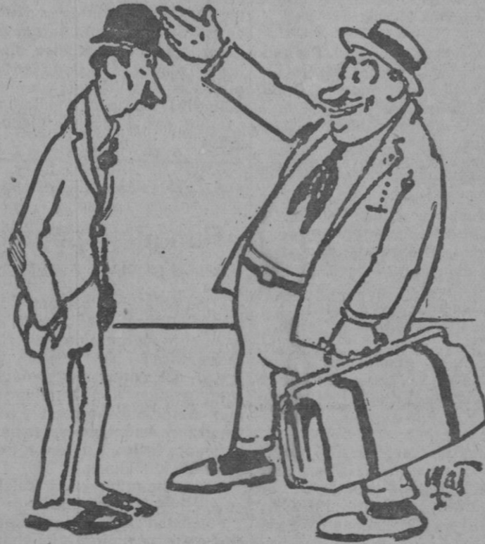
—Dicen que los viajes despiertan la inteligencia. —Pues tú debías dar varias veces la vuelta al mundo.

llegó a ser un hecho la deseada alianza.