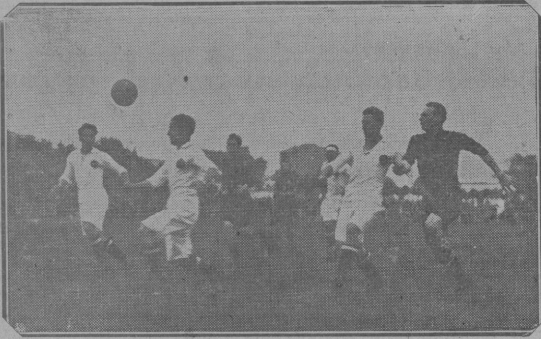
Del partido Madrid-Real Unión.—Una situación comprometida para la puerta madrileña