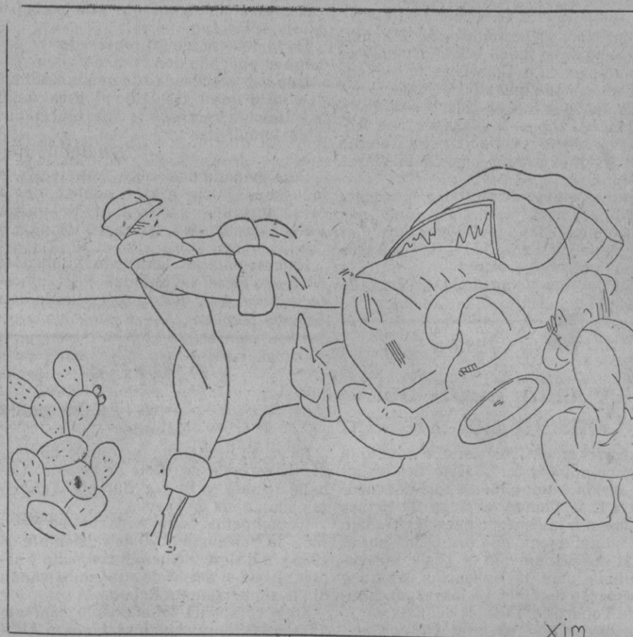
Ella—Pero, chico, ¿estabas en bacia? El—Calla, mujer, por ser la primera vez que lo guio no puedes exigirme más. Total: unos desperfectos.