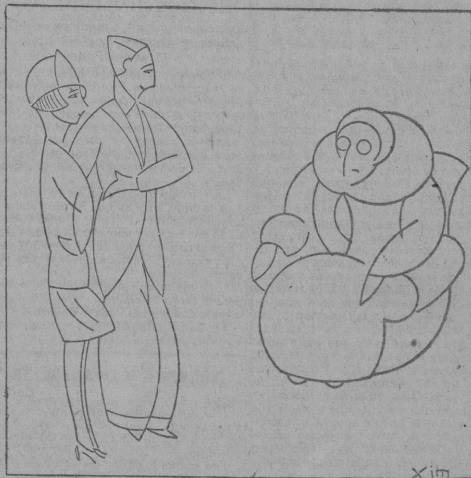
El novio.—Tengo, querida abuela, el gusto de presentarle a mi esposa. La abuela.—¿Sí? Pues, yo creía que era una salsicha.