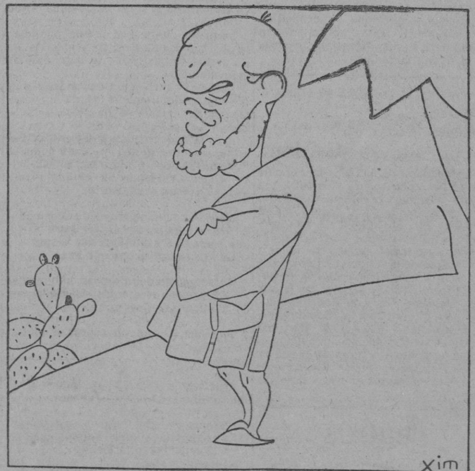
—No me sabe mal ir a la Reunión; lo que siento es tener que dejar estas chumberas en las que encontraba todas mis delicias.