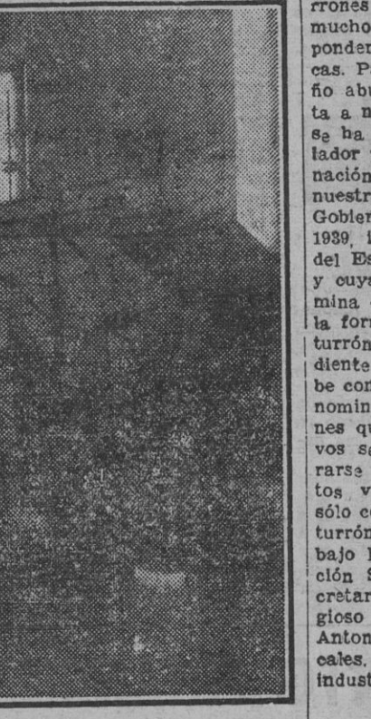
VISTA PARCIAL DE UNA FABRICA

ción precisa para el considerable número de envases que ha de utilizar, si bien advertimos claramente que dentro de las exiguas posibilidades presentes se nos atiende con un ponderable esfuerzo y solicitud por parte de los organismos correspondientes y las autoridades mencionadas.