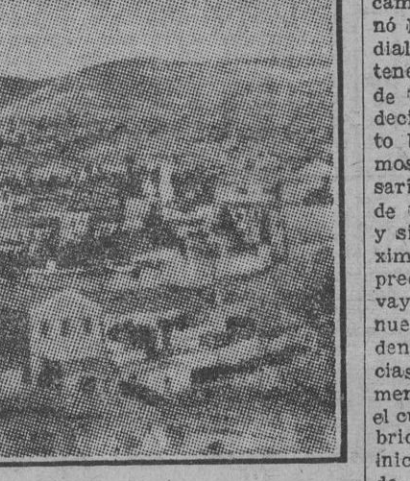
VISTA PARCIAL DE UNA FABRICA

Las circunstancias que en punto a la producción de las distintas industrias nacionales—sigue diciéndome el camarada Llorca Candela—determina la guerra de liberación y la mundial últimamente padecida habían de tener su repercusión en la nuestra de turrones, y así hemos venido padeciendo la falta de azúcar, elemento básico en esta producción. Sabemos el denodado interés de la Comisaría General de Abastecimientos y de nuestras autoridades provinciales y sindicales para otorgarnos las máximas cantidades posibles de aquel preciado elemento, y para todos ellos vaya la expresión una vez más de nuestro acendrado reconocimiento, y dentro de estas anómalas circunstancias lo que lamentamos profundamente es que no se nos pueda servir el cupo de azúcar asignado a estas fábricas con la antelación precisa al inicio de la campaña, allí en el mes de agosto, lo que, para asegurar la no interrupción de ella, determinaría que Jijona celebrase sus tradicionales fiestas de septiembre, sus reuniones y típicos festejos de "moros y cristianos", con la íntima complacencia de ver asegurada su labor trimestral, de cuyo éxito depende exclusivamente su economía y tranquilidad para sus hogares durante todo el año. La otra necesidad que la industria siente es la falta de la ciudad