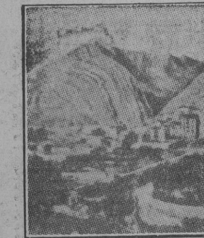
VISTA GENERAL DE JIJONA

Jijona se alza escalonada sobre una meseta. La carretera que desde Alicante o desde Alcoy da acceso a la población ha de salvar a su entrada a ella sendos precipicios, y es que dos lejos atravesados y sorprendentes han venido como a aliarla en la necesidad sobre la que se le-