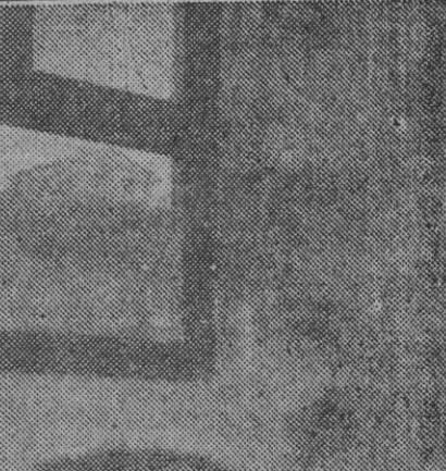
VISTA PARCIAL DE UNA FABRICA

dice—. Se ha procedido al asfaltado de casi todas las calles de la ciudad, a completar la red de su alcantarillado, reconstruir el hermoso patio baldío con jardines; reconstruir y reformar la Casa-Cuartel de la Guardia Civil, urbanizar completamente el Cementerio Municipal y construir en él 200 nichos nuevos y dotar con las disponibilidades que nuestro presupuesto nos permite los distintos servicios municipales. Proteger resultante toda manifestación artística y cultural, como lo prueba el hecho de subvencionar con 16.000 pesetas anuales la importante Academia de Música y Solfeo, que tanto acredita a esta ciudad y que dirige don Ricardo Martín, de la que es obra nuestra laureada Banda de Música, y atender a las necesidades de nuestra Beneficencia y al magnífico Asilo Hospital con que cuenta Jijona, con una capacidad para cien acogidos.