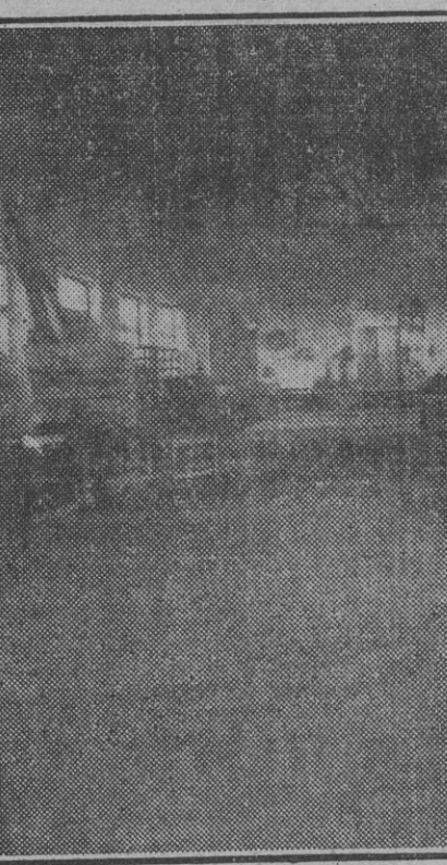
VISTA PARCIAL DE UNA FABRICA

—Puede decirse que en los primeros años de este siglo comienza a cobrar Jijona su respetable categoría como centro fabril. Se van levantando las primeras fábricas, que respondían en un todo a los más modernos adelantos. Se van perfilando los contornos de la hegemonía turronera de que goza, y la producción obtenida alcanza cifras muy estimables. Ya en 1930 se logra fabricar un millón de kilos, cifra que se duplica en los años 35 y 36, y tras el inevitable período de paralización casi completa, impuesto por nuestra guerra de liberación, comienza a 40 a marcarse de nuevo la curva ascendente en la producción, que logra ser en el año últi-