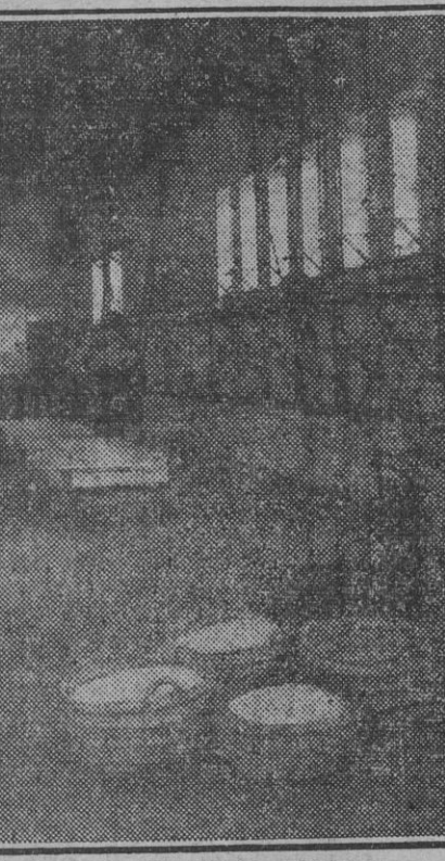
VISTA PARCIAL DE UNA FABRICA

de Gironá y abeto de Suecia, cuando la importación era posible. El número de obreros que en las 31 fábricas de turronero que actualmente cuenta Jijona es de unos 2.000, distribuidos en las siguientes clases: 670 varones oficiales y 80 aprendices, 1.200 mujeres y 95 aprendices. El jornal de los varones, cuya labor se hace a destajo, se regula por treinta y dos céntimos por kilo de turronero elaborado, pudiendo asegurarse que la cantidad media percibida por cada uno durante los tres meses que comprende la campaña de producción—20 de septiembre a 20 de diciembre—es de cuatro mil pesetas. El jornal de las mujeres es de 6,30 pesetas diarias, y he de advertir que las aprendizas dejan automáticamente de ser con-