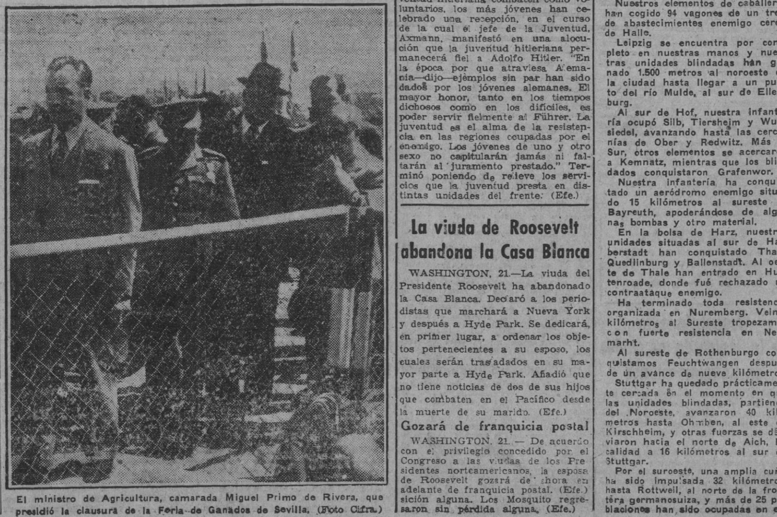
El ministro de Agricultura, camarada Miguel Primo de Rivera, que presidió la clausura de la Feria de Ganados de Sevilla.