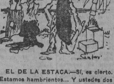
Estos hambrientos... y usted los debe echar a suertes...