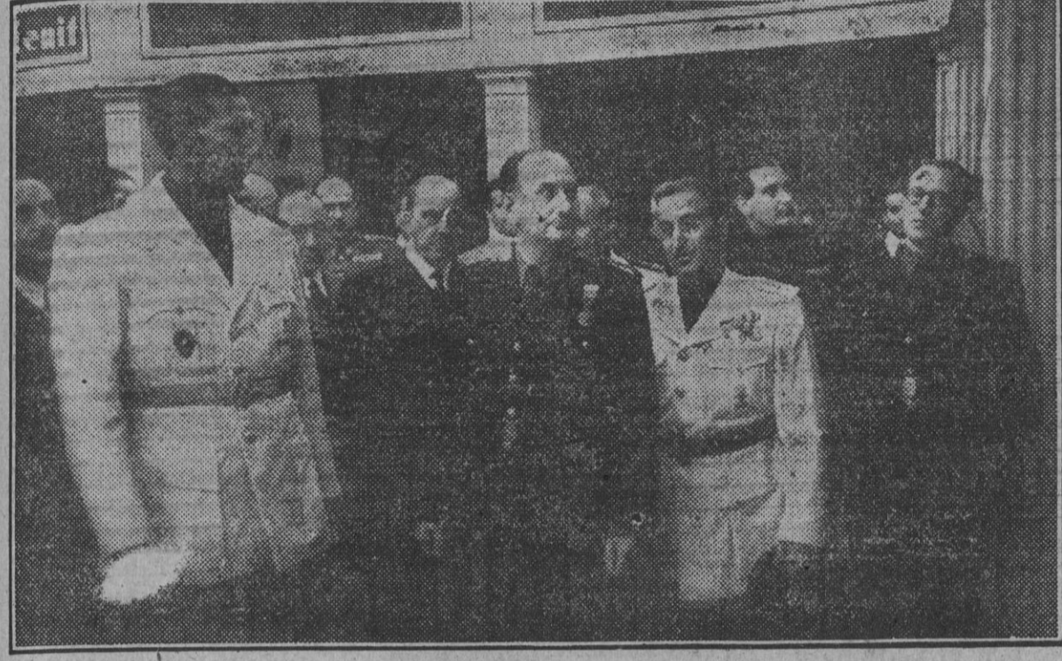
Los ministros secretario general del Movimiento, camarada José Luis de Arrese, y de Marina, almirante Morano, en el acto de inauguración de la Exposición de la Industria Eléctrica...

ASISTIERON AL ACTO LOS MINISTROS DE MARINA Y DE EDUCACION NACIONAL, EL DELEGADO NACIONAL DE SINDICATOS Y OTRAS JERARQUIAS Y AUTORIDADES