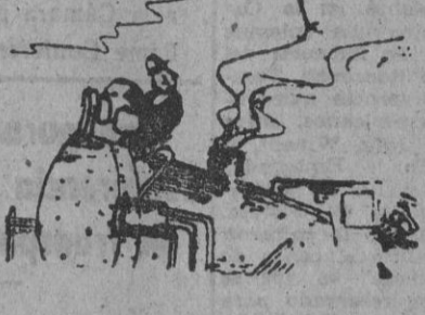
—¿Qué hace usted ahí? —Es que me gusta llegar primero a todas partes.