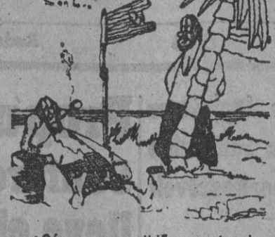
—¿Cómo es posible que te dure tanto el tabaco? —Es que me estoy fumando los calcetines...