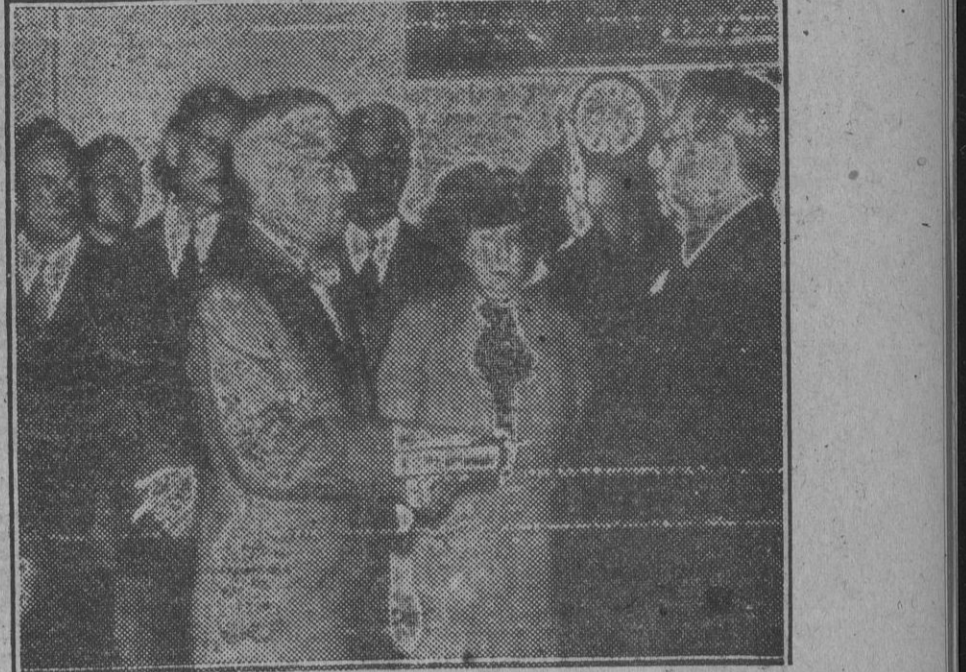
Harry S. Truman, Presidente de los Estados Unidos, en el momento de prestar juramento ante el presidente del Tribunal Supremo.