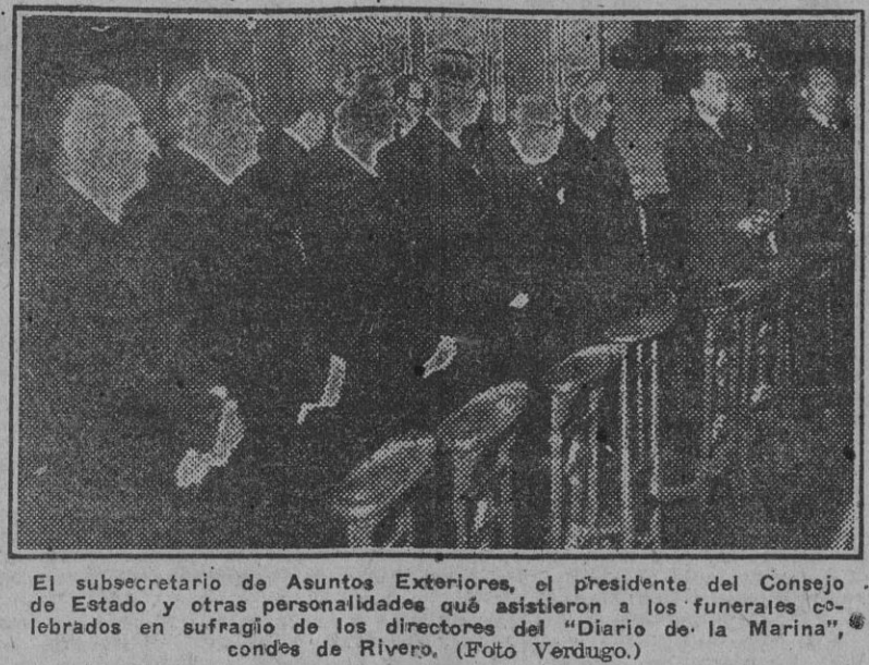
El subsecretario de Asuntos Exteriores, el presidente del Consejo de Estado y otras personalidades que asistieron a los funerales celebrados en sufragio de los directores del "Diario de la Marina", donde se casó el río.