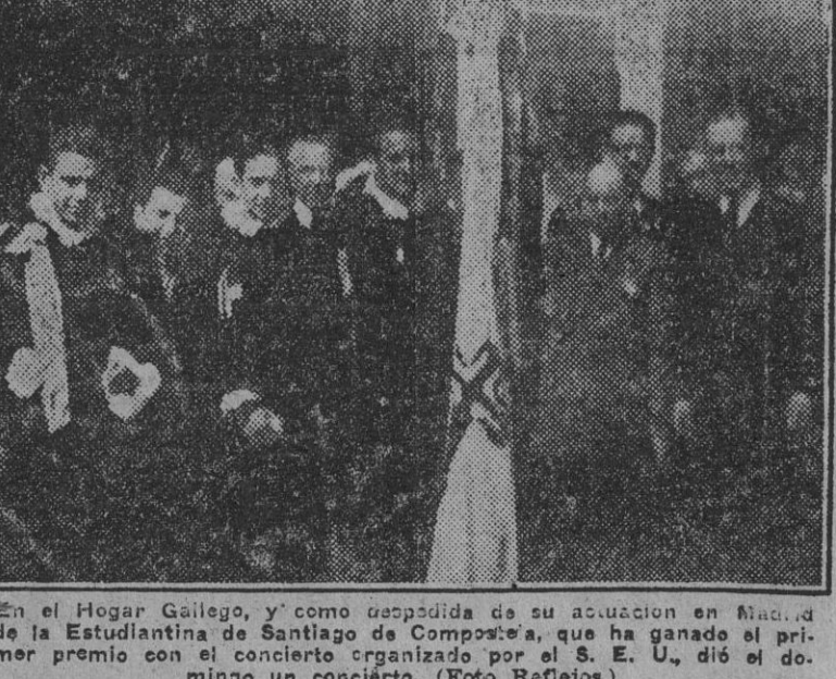
En el Hogar Galego, y como despedida de su actuación en Madrid de la Estudiantina de Santiago de Compostela...