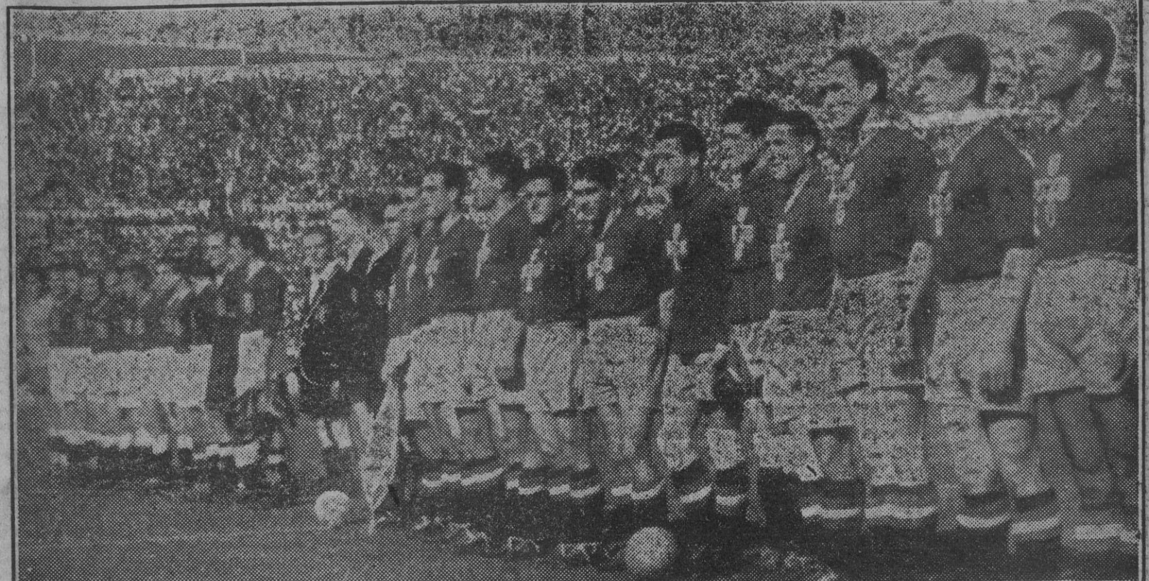
El equipo español y el portugués, aineados en el centro del terreno del grandioso estadio, escuchan los himnos nacionales, cuyas últimas notas apagan las ensordecedoras aclamaciones de un público entusiasta y ejemplarmente deportivo.

(Véase en nuestra sección deportiva amplia información del partido de ayer en Lisboa, por nuestro enviado especial José María Ubeda).