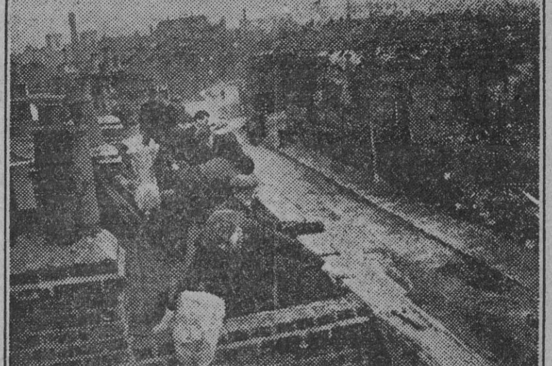
Obreros voluntarios ingleses, que vinieron de una ciudad del norte de Inglaterra, trabajan en la reparación de unas casas londinenses que sufrieron daños de las bombas V.