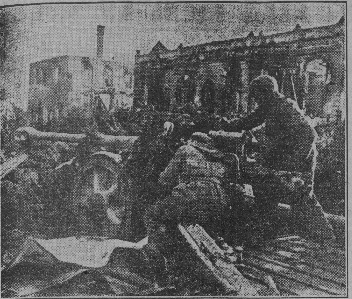
Ruda e ininterrompida, abunda en dramáticos episodios la lucha que se mantiene en todo el frente del Este. Esta fotografía muestra a un grupo de soldados alemanes, situado entre las ruinas de la ciudad con el conveniente "camouflage", cuyo oficial da la orden de abrir fuego ante el avance del adversario.