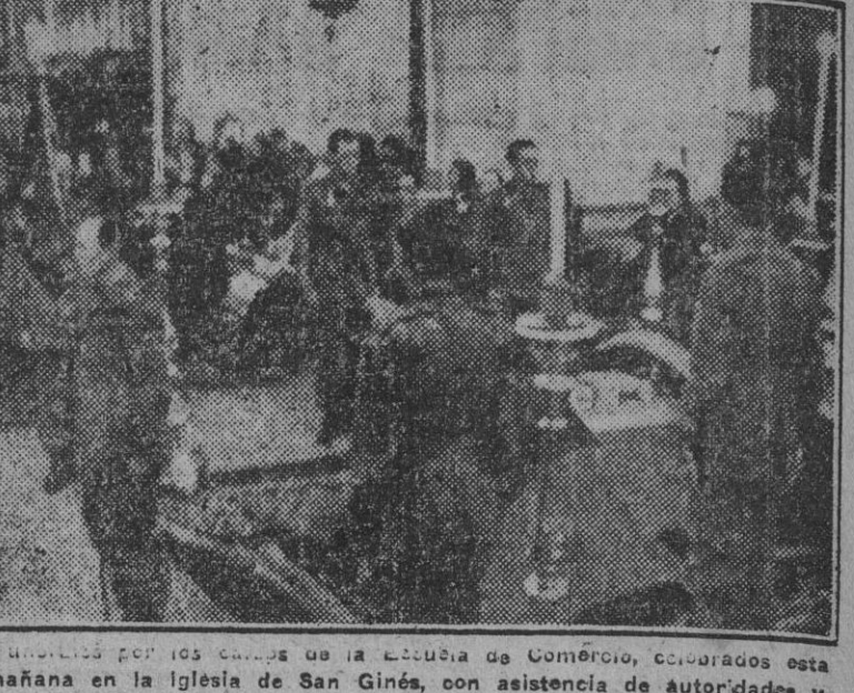
Funerales por los restos de la Estrella de Comercio, celebrados esta mañana en la Iglesia de San Gines...