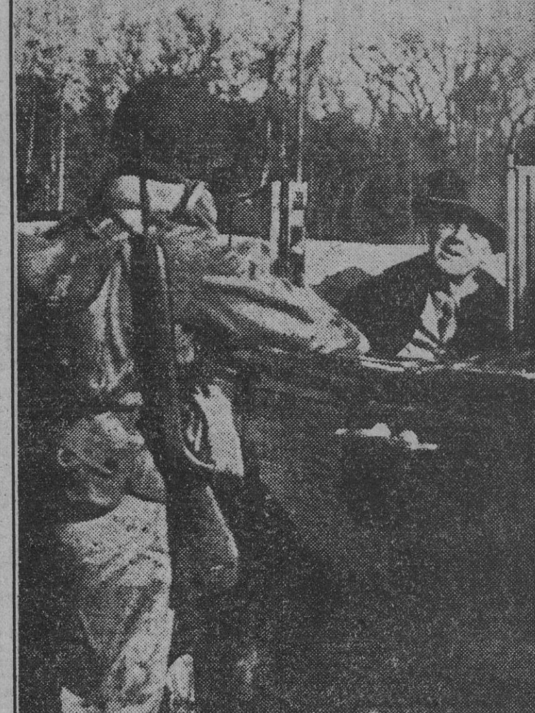
El Presidente norteamericano conversa con un soldado de Infantería de Marina durante una visita de aquí a un campamento del frente.