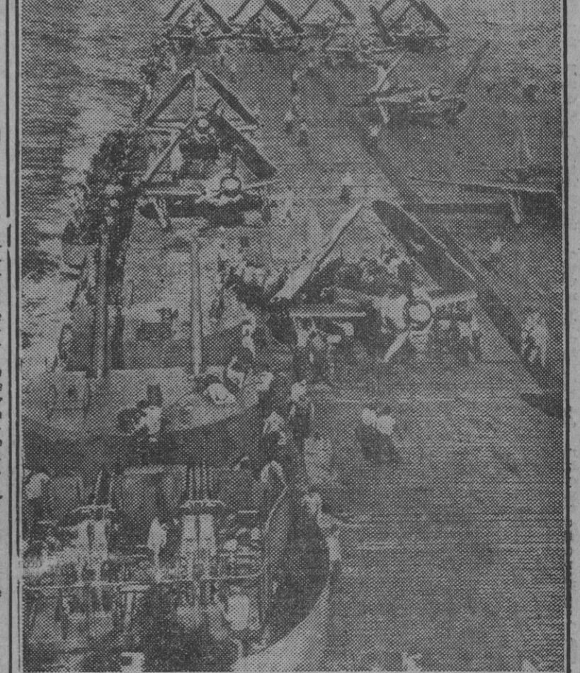
Esta fotografía muestra claramente parte del armamento en la banda de un moderno portaviones. En primer término se ve una batería de cuatro ametralladoras pesadas de 40 milímetros. Detrás, una torre con dos piezas gemelas de 125 milímetros. En el saliente o galería sobre el mar, ametralladoras de 20 milímetros. Los aparatos están sobre cubierta con las alas plegadas. Estos buques se desplazan a gran velocidad, entre 25 y 30 nudos, a la que suman, para su mejor defensa, un tremendo volumen de fuego con armas medianas y ligeras.