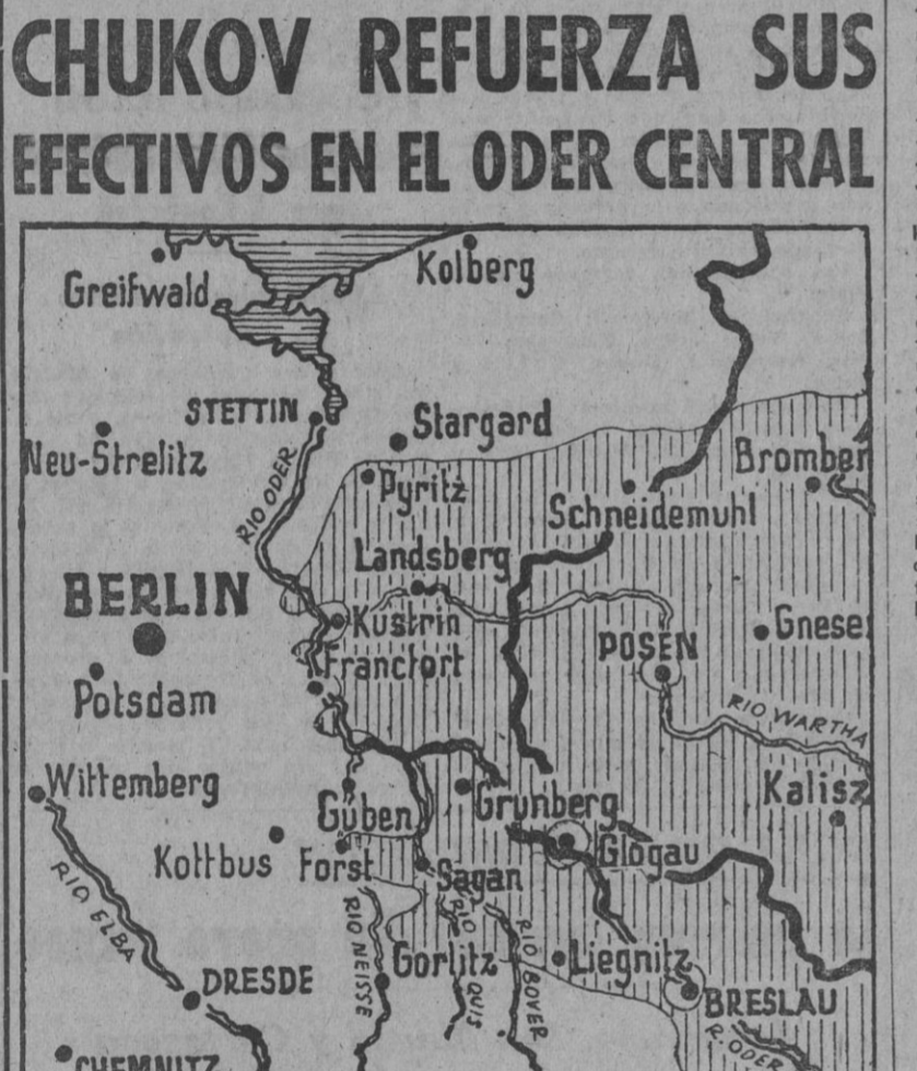
El centro de gravedad de los luchos en el frente del Este sigue siendo el sector central, en el Oder...