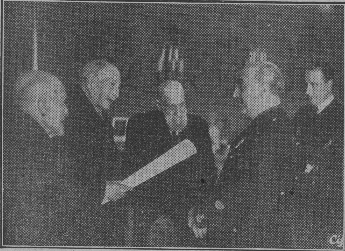
Su Excelencia el Jefe del Estado, Generalísimo Franco, recibe en audiencia a una representación de veteranos carlistas...