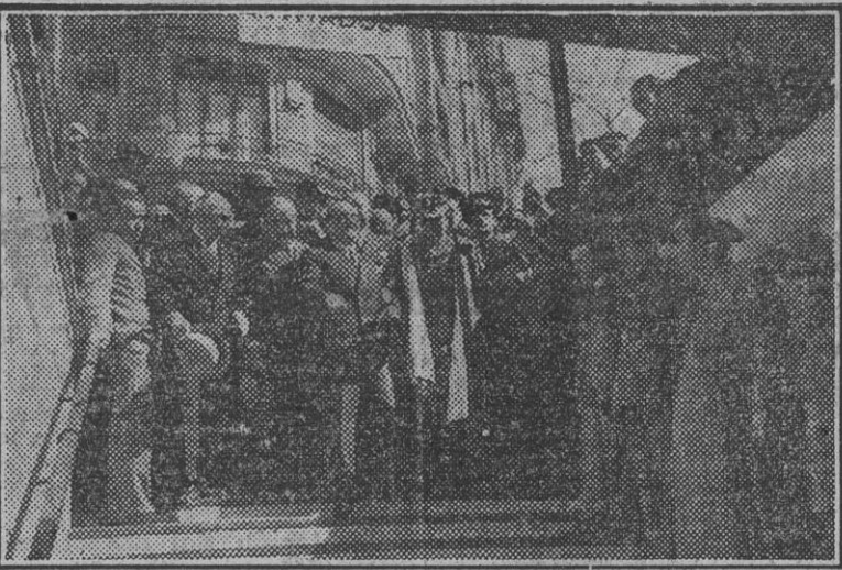
El ministro de Obras Públicas, el alcalde de Madrid y otras autoridades en la inauguración oficial de la nueva línea del Metro...

Mañana, a las seis y media, quedará abierta al público