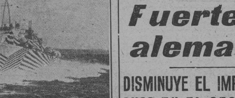
Una lancha torpedera de la Marina norteamericana, perfectamente camuflada para evadir la observación enemiga.