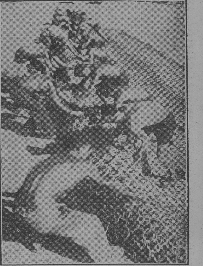
Las fuerzas navales rumanas emplean para la defensa de sus bases navales una red de anillas de acero, cuya misión consiste en detener los torpedos. He aquí a un grupo de marinos preparando una de estas redes.