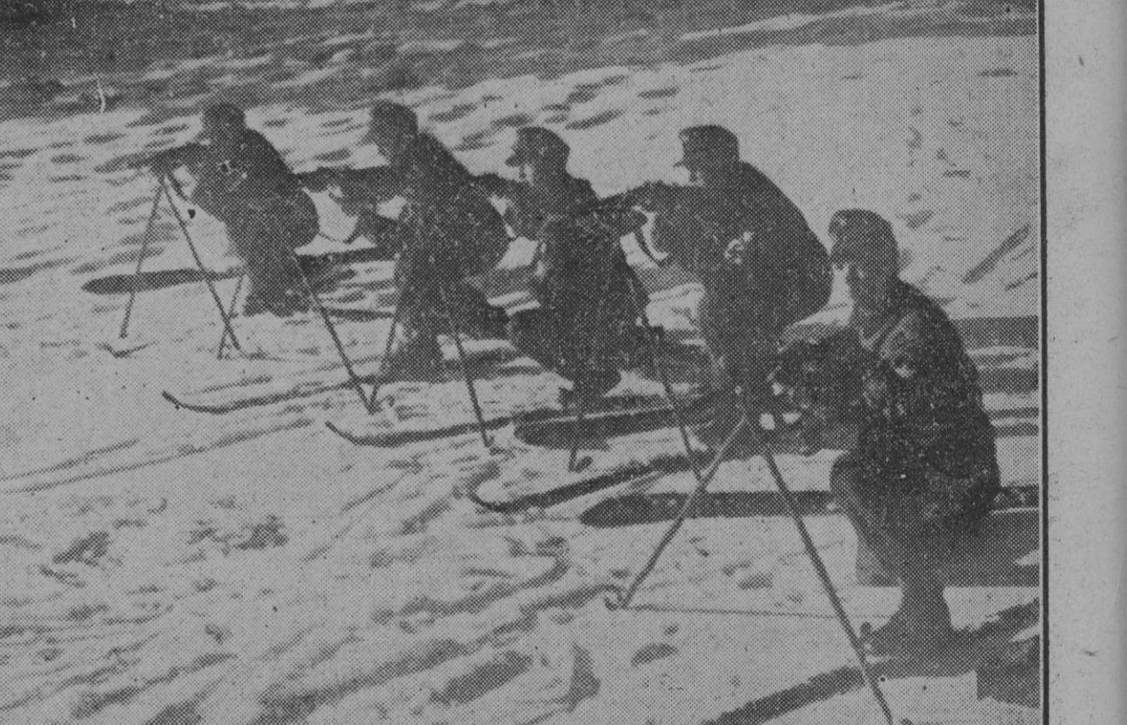
Una patrulla de soldados alpinistas alemanes haciendo prácticas de tiro en la nieve. A los esquís se suma, como equipo especial de esta clase de tropas, un bipode sobre el que se apoyan los fusiles para mayor seguridad y eficacia de los disparos.