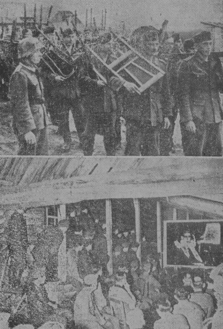
La cuadra de los caballos sirve de "palacio de cine". Las sillas tienen que traerlos los visitantes. Se proyecta una gran película de Herta Feller. Los soldados contemplan atentamente las diversas escenas del alegre film.