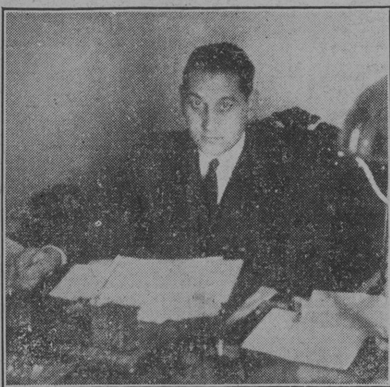
Don Carlos Pinilla, director general de Administración Local, que viene desempeñando una magnífica labor al frente de aquel Departamento.

La mejor prueba de que la política municipal española no era reflejo de una auténtica realidad rancia en los esfuerzos de todos los partidos por renovar y mejorar la vida de los Ayuntamientos. Tales intentos fueron siempre nulos, porque la tarea es de gran volumen y requiere tiempo, meditación y cierta estabilidad política. Y pedir esa tranquilidad a un país como el nuestro que vivió de bandazo en bandazo desde mediados del siglo XIX es acariciar vanas ilusiones. Y así se dió el contrasentido de que la ley de 1877, que dejó insatisfechos a todos los partidos políticos, perduró durante largo tiempo y naufragaron en el fracaso todas las tentativas dirigidas a reformar el régimen local. Tal sucedió con el proyecto Maura de 1907. De cómo fue combatido este proyecto que tantas novedades provechosas contenía dan idea estos datos: se presentaron cerca de dos mil enmiendas y se pronunciaron más de 3.600 discursos, y, ¡claro!, el proyecto quedó en eso, en proyecto, arrojado en el rincón de los nobles propósitos.