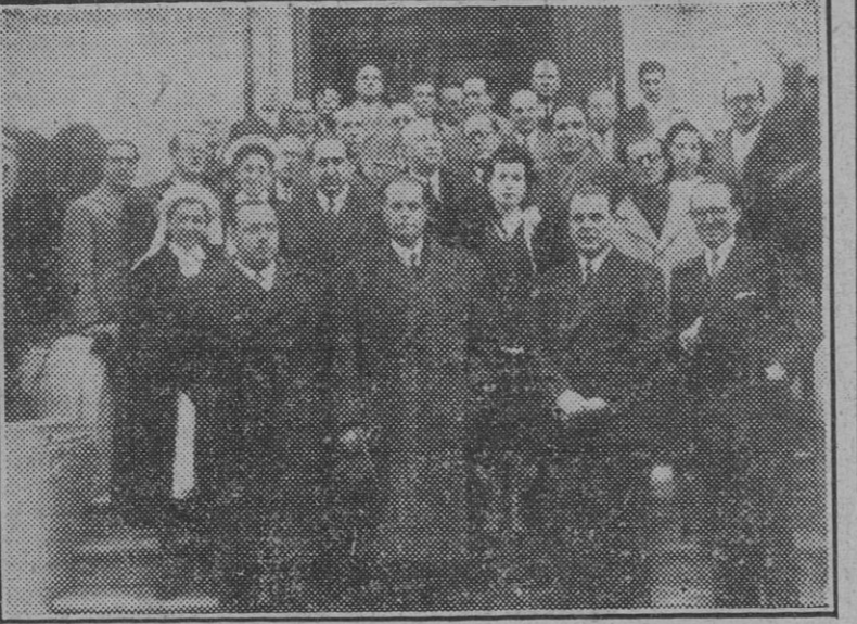
El ministro de la Gobernación a la salida del acto de clausura de las reuniones del Cuerpo Nacional de Sanidad.