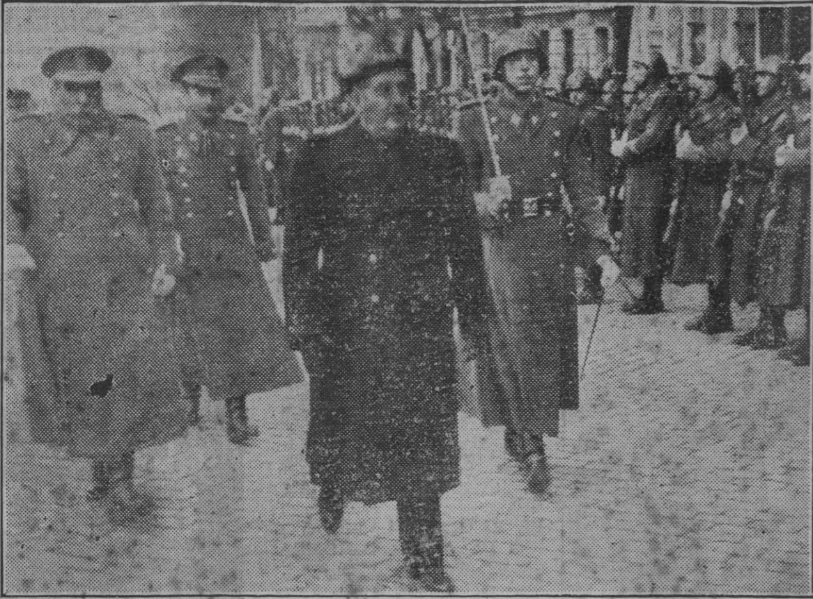
Su Excelencia el Jefe del Estado, a su llegada al edificio de la Real Academia Española para presidir la reunión plenaria del Consejo Superior de Investigaciones Científicas, revista las tropas que le rindieron honores.

Nuevamente la música militar dejó oír los sonos del Himno Nacional, y con los mismos honores que a la llegada abandonó la Real Academia Española el Caudillo, respondiendo brazo en alto, a un jald y a otro desde el coche, a la despedida vibrante que personalidades y pueblo le tributaban.