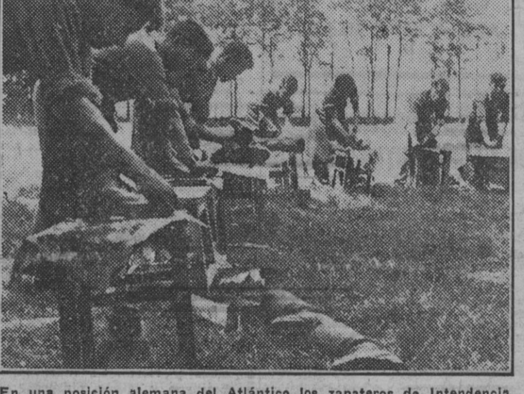
En una posición alemana del Atlántico los zapateros de Intendencia reparan al aire libre el calzado de la tropa y dejan las botas viejas en condiciones de ser estrenadas de nuevo.